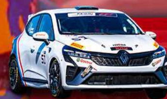
RENAULT CLIO CUP V