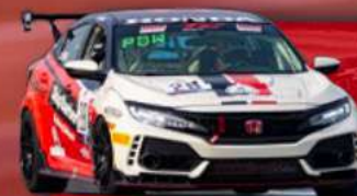
HONDA CIVIC TYPE R