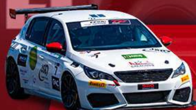
PEUGEOT 308 RC