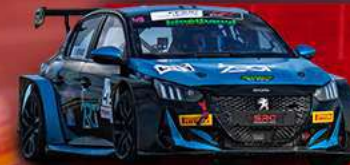
PEUGEOT 208 TC