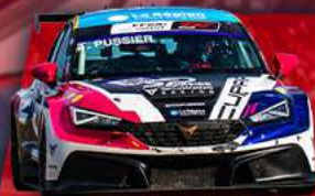
CUPRA LEON COMPETICION TCR