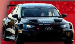
AUDI RS3 LMS TCR