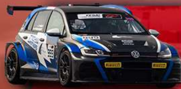
VOLKSWAGEN GOLF GTI TCR