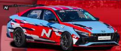
HYUNDAI ELANTRA N CUP