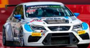
SEAT LEON CUP RACER