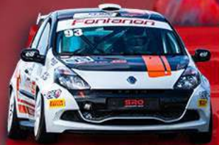
RENAULT CLIO CUP III