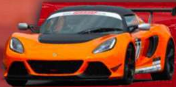
LOTUS EXIGE V6 R CUP