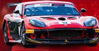
GINETTA G40 CUP