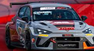
CUPRA LEON VZ TCR