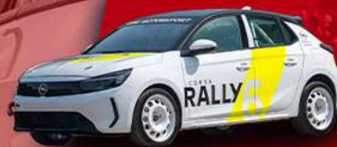
OPEL CORSA RACING TC6