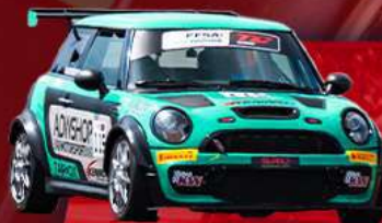
MINI R56 MCS-R