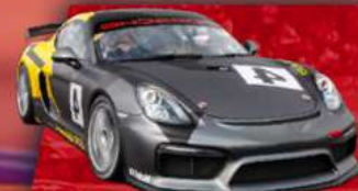
PORSCHE CAYMAN GT4 CLUBSPORT