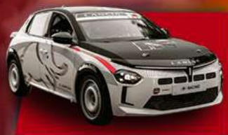
LANCIA YPSILON HF RACING TC6