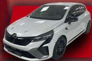
RENAULT CLIO TC6