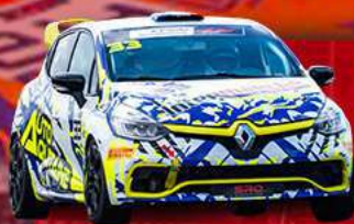
RENAULT CLIO CUP IV