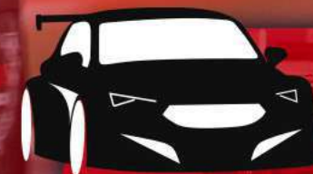
PROPOSEZ-NOUS VOTRE MODÈLE