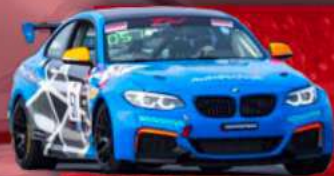
BMW M235 CUP/M240i RACING