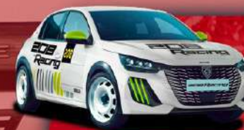
PEUGEOT 208 RACING TC6