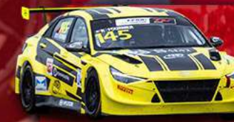
HYUNDAI ELANTRA N TCR