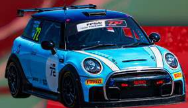
MINI JCW CHALLENGE