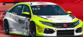
HONDA CIVIC FK7 TCR