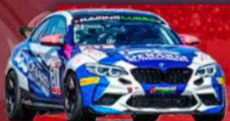
BMW M2 CS RACING