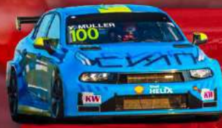
LYNK & CO 03 TCR