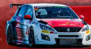
PEUGEOT 308 TCR