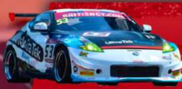
NISSAN 370Z GT4