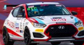
HYUNDAI VELOSTER N