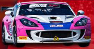
GINETTA G55 CUP