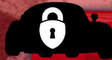
PRÉSENTATION EN JANVIER